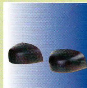
Puntera - Toecap

USE: Ideal boot to be worn at the construction industry where the steel toe cap can resist the fell down of a heavy object 20 kg from 1 meter high. The steel midsole can resist the penetration pressure of 5 Newtons.