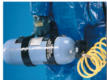
Configuración de baja presión