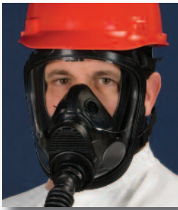
Respirador de Línea de Aire de Flujo Constante con Máscara Advantage 4000