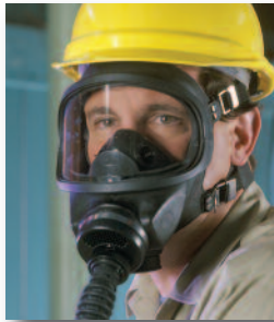
Respirador de Línea de Aire de Flujo Constante con Máscara Ultravue