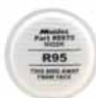
Filtro 8970 R95