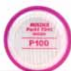
Disco Filtro 7940 P100