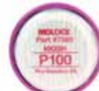
7960 P100 Disco Filtro con Molestia VO