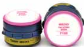
7640 Cartucho Smart Multigas-Vapor/P100