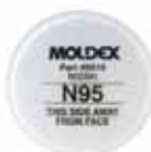
Filtro 8910 N95