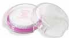
7999 Tapa Protectora de Chispas y Salpicaduras