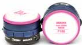
7140 Cartucho Vapores Orgánicos/P100