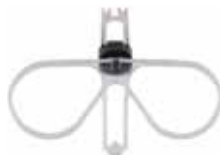
0098 Kit de Anteojos