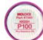
7950 Disco filtro P100 + Molestia VO/GA