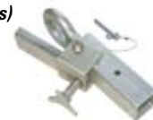
■ Adaptador para enganche de clavija DH-15/