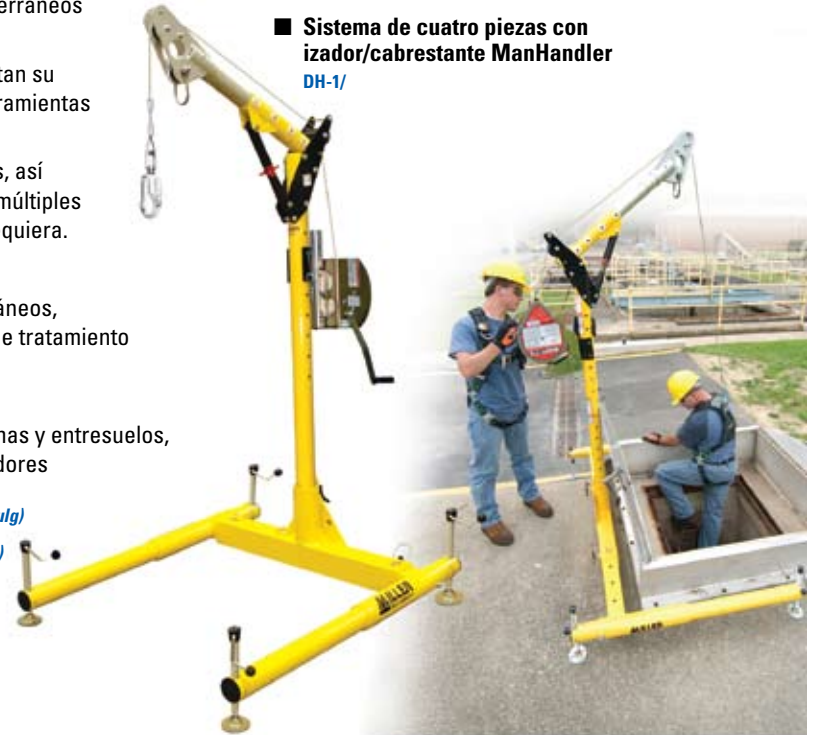
■ Sistema de cuatro piezas con izador/cabrestante ManHandler DH-1/