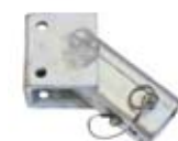
■ Receptor monodireccional de parachoques DH-17/