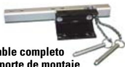
■ Ensamble completo del soporte de montaje DH-19-MILLER/

(El DH-19-MILLER es un ensamble de los soportes DH-19/ y DH-AB-MILLER/)