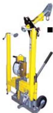
■ Carretilla para equipo DuraHoist DH-18/