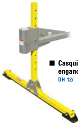
■ Casquillo de montaje para enganche de vehículo DH-12/

Está diseñado para ser colocado en el receptor de enganche de 0.05 m (2 pulg) de un vehículo con el fin de ofrecer un punto de anclaje portátil para entrada, recogida, rescate y detención de caídas en espacios confinados.