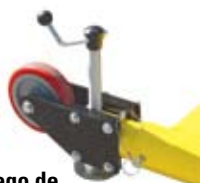
■ Juego de ruedas para base DuraHoist de tres piezas DH-4WK/