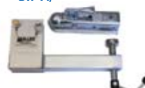
■ Adaptador de 0.05 m (2 pulg) para enganche de bola DH-16/