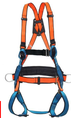
IMAGEM falta argolas nos ombros