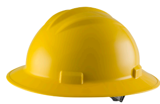
S71 (ala completa)