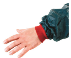
Diseño con doble puño