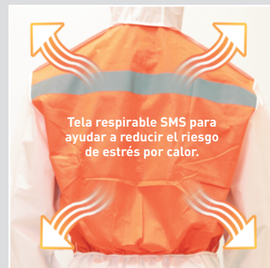
Tela respirable SMS en el torso