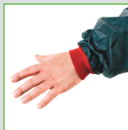
El diseño de dobles puños