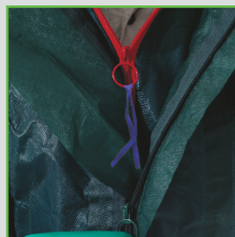
El sistema de doble cremallera

Diseñado para proteger - el traje típico incluye sistema de doble cremallera y doble manga